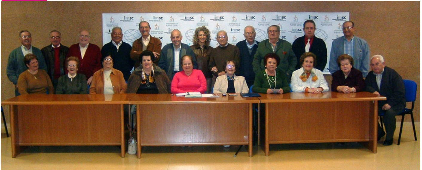
Mesa Local del Mayor

Se acerca la Navidad y con ella se despide una vez más otro año. Hay personas que en estas fechas se ponen nostálgicas, recordando los momentos pasados, entrañables, y que ya quedaron atrás.