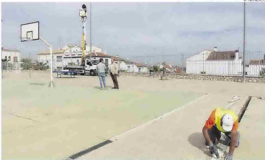
Una de las zonas donde se ejecutará esta obra es Nelía de Las Nieves.

En segundo lugar, el Consistorio define un segundo bloque en el sector suroeste, desde de La Calzada al barrio de Nelía de las Nieves y bordeado por la Ronda Sur.