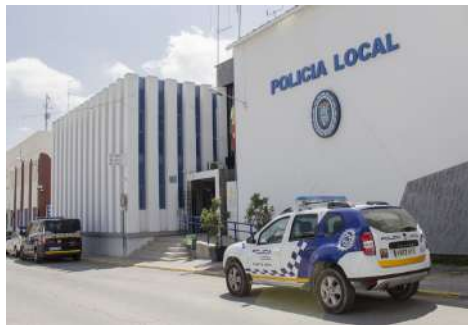
Policía Local C/Concejal Rodríguez Chía Teléfono: 957 60 68 75