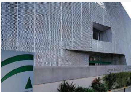
Centro de Salud José Gallego Arroba

En los dos centros de salud existen comisiones de violencia de género, integradas por diferentes profesionales del Sistema Sanitario Público de Andalucía (SSPA), para mejorar procedimientos y atención a las víctimas.