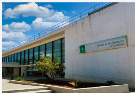
Centro de Salud Puente Genil II