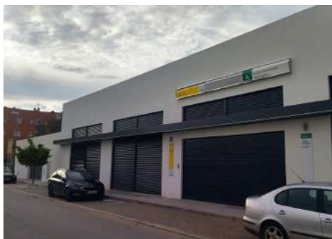
Servicio Público de Empleo Estatal (SEPE) C/ Alcalde Antonio Romero, 11 Teléfono: 957 11 84 86