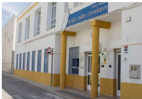
Servicios Sociales C/ Antonio Sánchez Cuenca Teléfono: 957 60 92 72